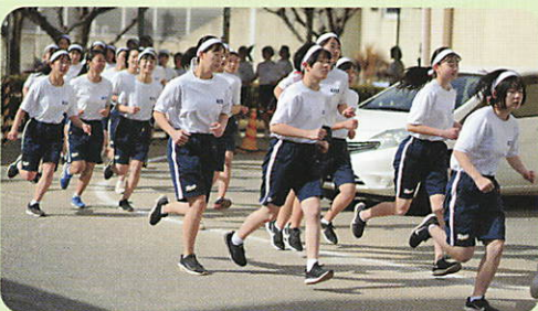
校内マラソン大会