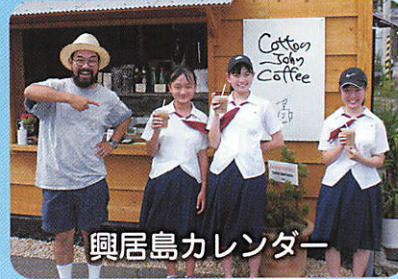
興居島カレンダー