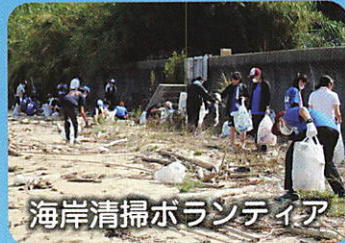
海岸清掃ボランティア