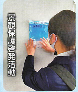
景観保護啓発活動