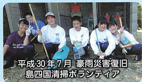
平成30年7月 豪雨災害復旧 島四国清掃ボランティア