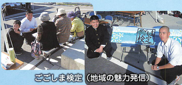
ごごしま検定 (地域の魅力発信)