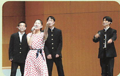
【文化祭・文化発表会】