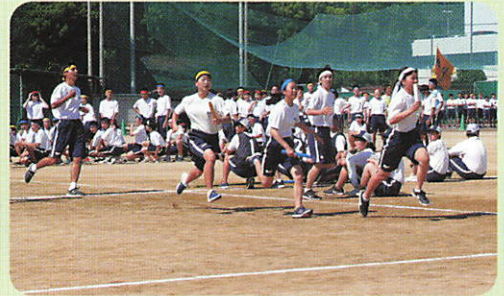
【リレーカーニバル】