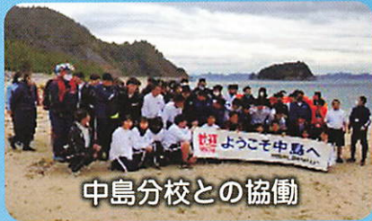
中島分校との協働

“Glocal”とは、SDGsなど世界的な視点で身近な地域社会の課題をとらえ、課題解決のために、まず足許から行動することです。本校は、SDGsの目指すGoalに沿ったさまざまな活動を展開しています。