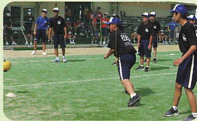
【グループマッチ・クラスマッチ】