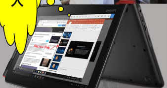
一人一台のクロームブック