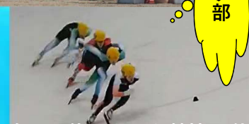
冬の国体 スケート競技 4位