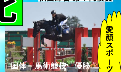
国体 馬術競技 優勝